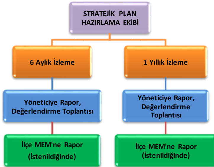
Şekil 3: İzleme ve Değerlendirme Süreci

Müdürlüğümüzün 2019-2023 Stratejik Planı İzleme ve Değerlendirme sürecini ifade eden İzleme ve Değerlendirme Modeli hazırlanmıştır. Müdürlüğümüzün Stratejik Plan İzleme-Değerlendirme çalışmaları eğitim-öğretim yılı çalışma takvimi de dikkate alınarak 6 aylık ve 1 yıllık sürelerde gerçekleştirilecektir. 6 aylık sürelerde rapor hazırlanacak ve değerlendirme toplantısı düzenlenecektir. İzleme-değerlendirme raporu, istenildiğinde İlçe Milli Eğitim Müdürlüğü'ne gönderilecektir. Ayrıca ilçemizin Mülki İdari Amirine sunulacaktır. 1 yıllık izleme-değerlendirme çalışmaları, Stratejik Planımızda yer alan hedeflerin yıllık düzeyde ifade edildiği Performans Programı ve yılsonunda gerçekleşme düzeylerinin belirlendiği Faaliyet Raporu hazırlanarak yapılacaktır.